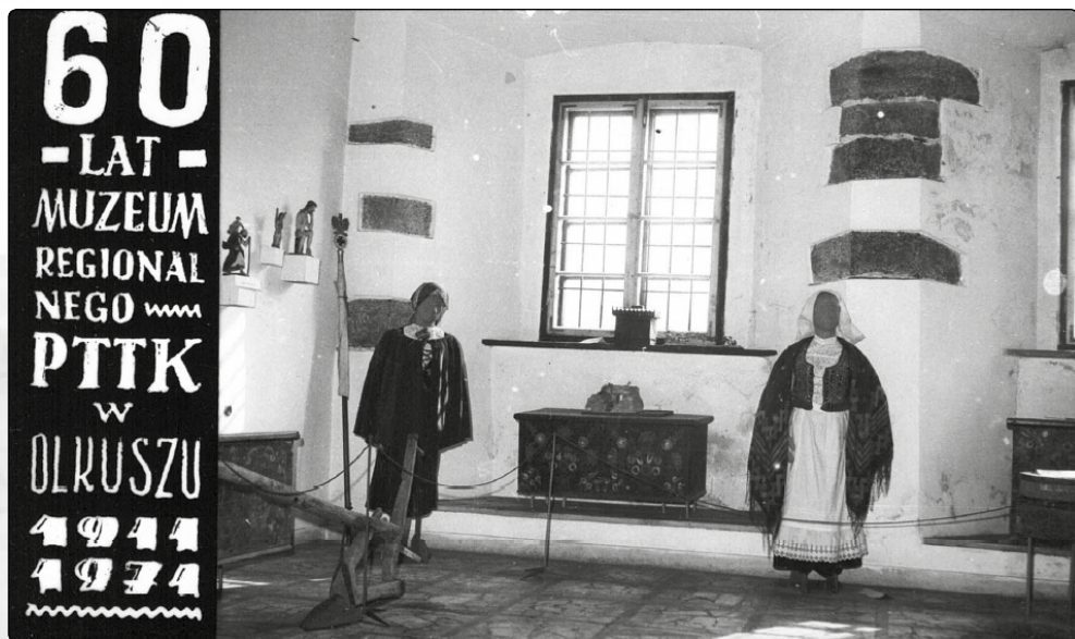
Muzeum Regionalne PTTK w Olkusz, 1971 rok

wiono działalność Muzeum Regionalnego. W 1967 r. kustoszem muzeum została Gryzelda Kałka-Tobołowa, która uporządkowała bibliotekę muzealną, przeprowadziła inwentaryzację eksponatów i dokumentów. Z jej inicjatywy rozpoczęto kolejne prace