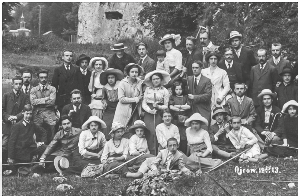
Wycieczka olkuskiego koła Polskiego Towarzystwa Krajoznawczego do Ojcowa (z tyłu widoczna Kaplica na wodzie)

Królestwa Polskiego. Do 1914 roku organizacja działała w konspiracji. Po rozwiązaniu „Sokoła” powstało Stowarzyszenie Gimnastyczne „Piechur”, które nawiązywało do tradycji „Sokoła”. W 1917 roku powstało w Olkuszu Towarzystwo „Piechur”, które także prowadziło działalność kulturalną. W 1918 roku austriacki Komendant Powiatowy rozwiązał Towarzystwo Gimnastyczno-Turystyczne „Piechur” w Olkuszu, a także w Pilicy, Wolbromiu i Żarnowcu za „demonstrację życia politycznego”. 12