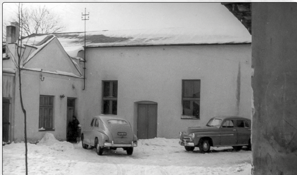
Siedziba Powiatowego Domu Kultury przy ul. Gęsej