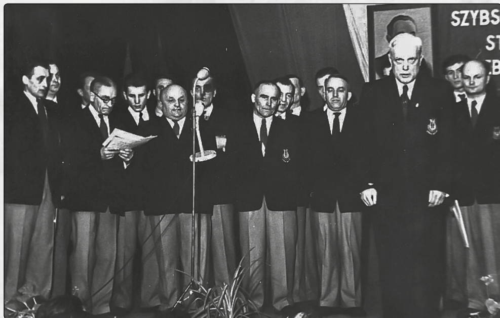
Występ chóru „Hejnał”, 1956 rok, źródło: Zeszyty Historyczne Olkusza nr 15, s. 79

W świetlicy fabrycznej działał też amatorski zespół teatralny. Tam też gościnnie występował Teatr Zagłębia z Sosnowca, odbywały się koncerty, zabawy taneczne i występy kabaretów. W sezonie 1966-1967 występowali m.in. Jacek Fedorowicz, Bohdan Łazuka i Piotr Szczepanik.