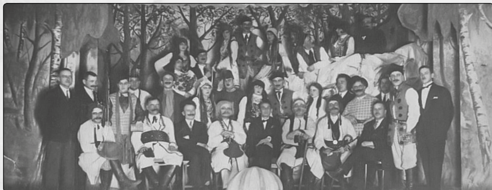
Zespół amatorski w Olkusz, przedstawienie „Czartowska Ława”, 1929 rok