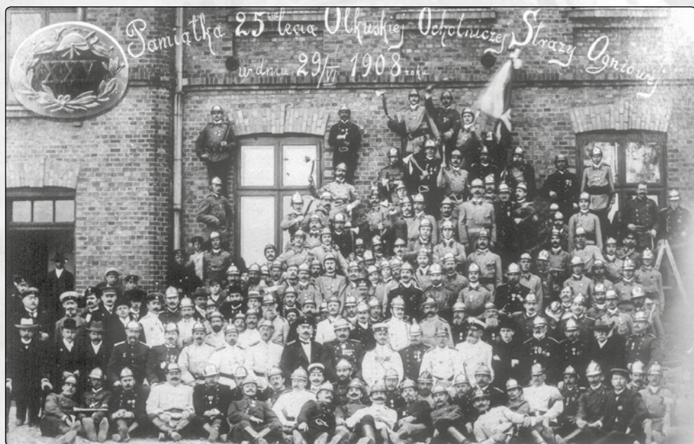
Olkuska Straż Pożarna podczas jubileuszu 25 lecia w 1908 roku.

oletnich staraniach o założenie własnej straży ogniowej, w 1878 roku w olkuskim magistracie odbyło się zebranie założycielskie. Statut „Olkuskiego Ochotniczego To-