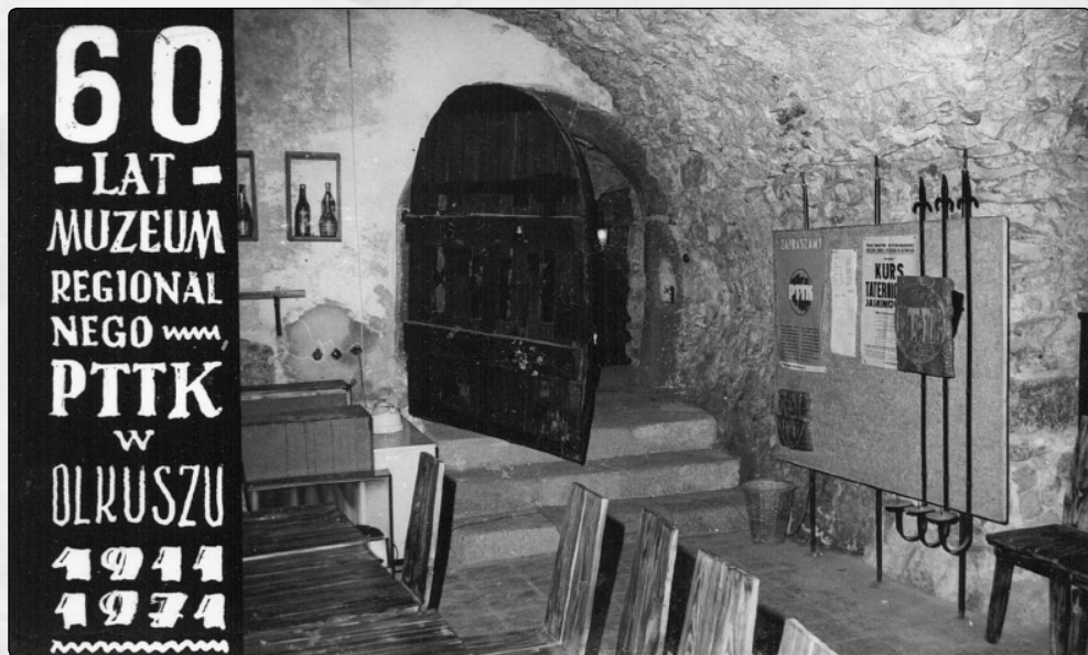
Klub „Hades” w piwnicach olkuskiej siedziby PTTK, 1971 rok