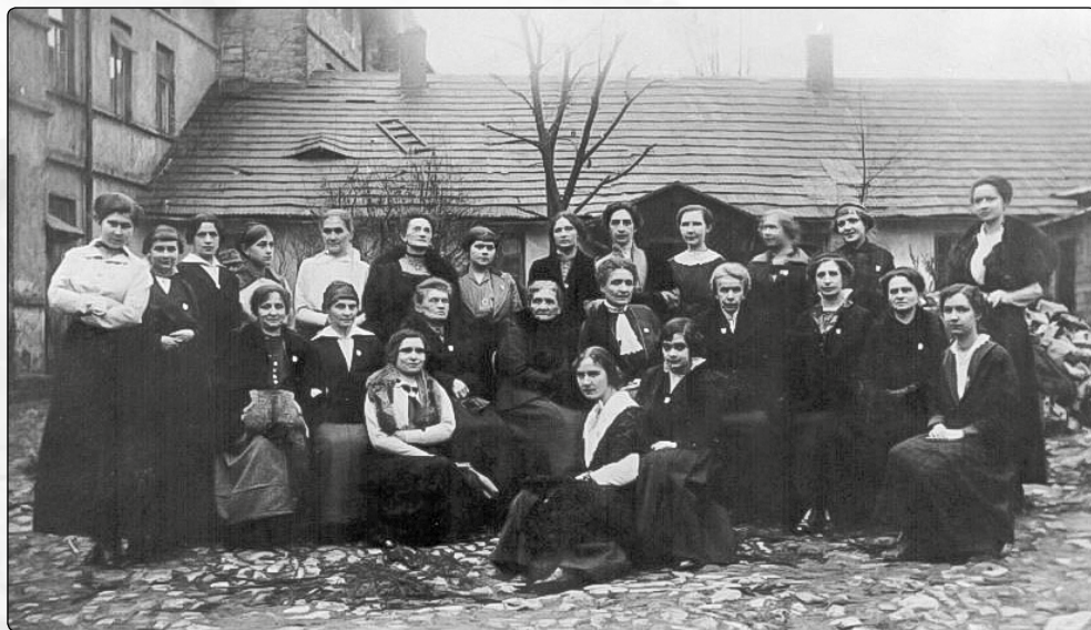
Członkinie olkuskiego koła Ligi Kobiet Pogotowia Wojennego, Marzec 1915 rok.

ły 10 obchodów rocznicowych, 24 odczyty w mieście i 22 pogadanki historyczne na wsiach. 14