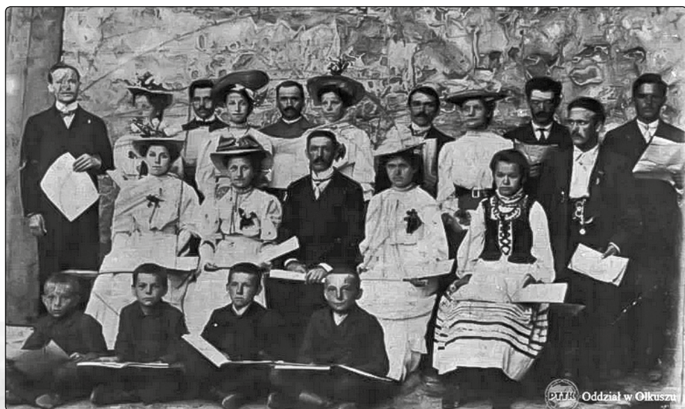
Chór żeński w Olkuszu. 1910 rok