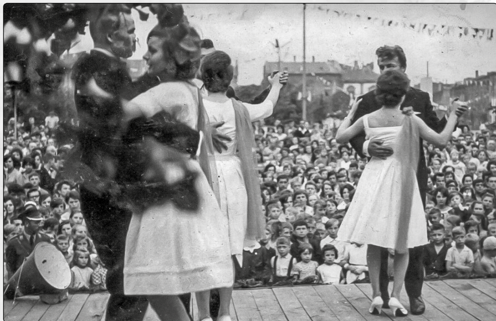
Dni Ziemi Olkuskiej

kuszu wydarzenia te były organizowane przez Powiatowy Dom Kultury. Od 1971 roku doroczne święto miasta odbywało się