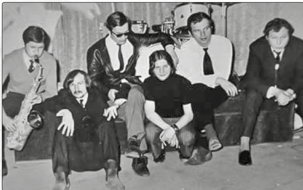
Zespół muzyczny „Orion 5” działający przy olkuskim PSS, fot. arch. Andrzeja Wąsa

Podjęto próby zorganizowania w świetlicy mieszanego chóru młodzieżowego ZMP oraz zespołu mandolinistów. Nadal działało kino „Emalia”, miała tu swoją siedzibę zakładowa orkiestra dęta, a w latach 50. część członków orkiestry zaczęła występować w składzie big bandu, który prowadził Emilian Kubiczek. 46