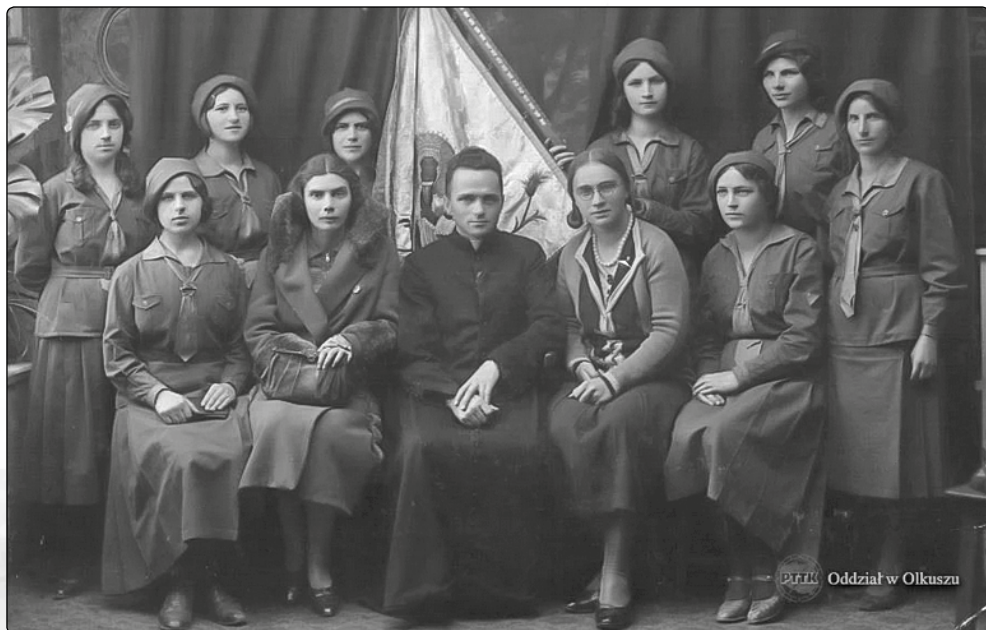
Zarząd Katolickiego Stowarzyszenia Młodzieży Polskiej Żeńskiej w Olkusz

urządzenie przez rzemieślników w niedziele i dni wolne od pracy przedstawień teatralnych, z których dochód przeznaczano na cele charytatywne”. Jak wynika z relacji w „Gazecie Kieleckiej” prowadził je piekarz Gajer, były aktor. 24