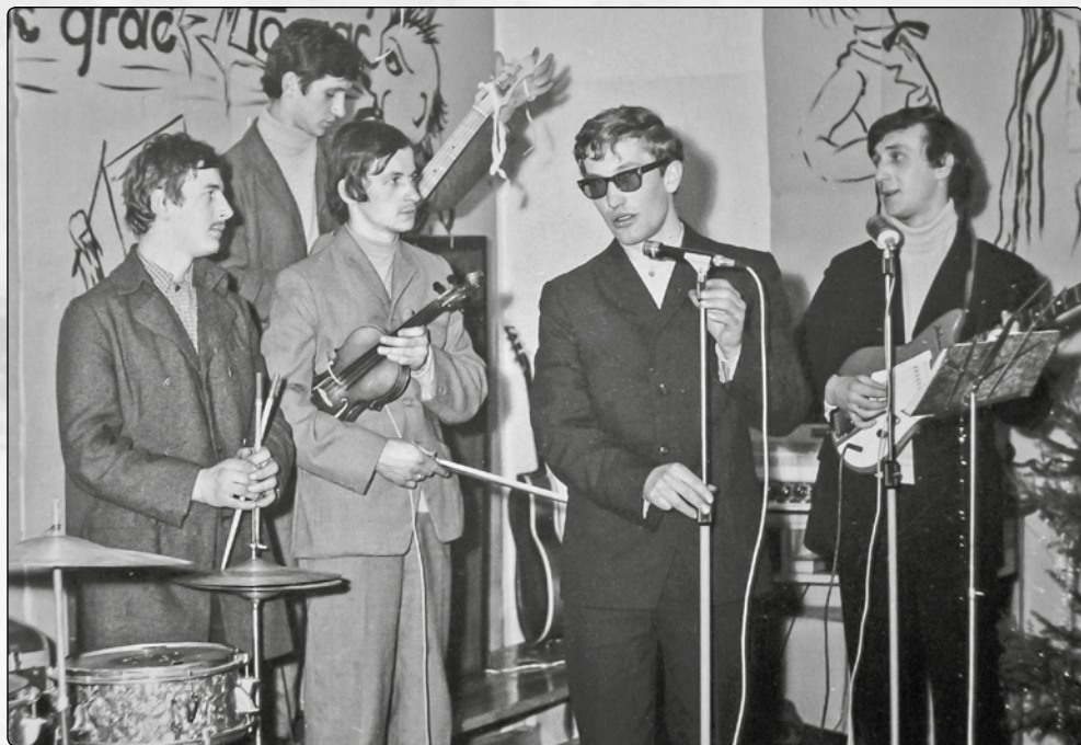
Zespół „Ilkusy”, fot. arch. Wojciecha Włodarczyka