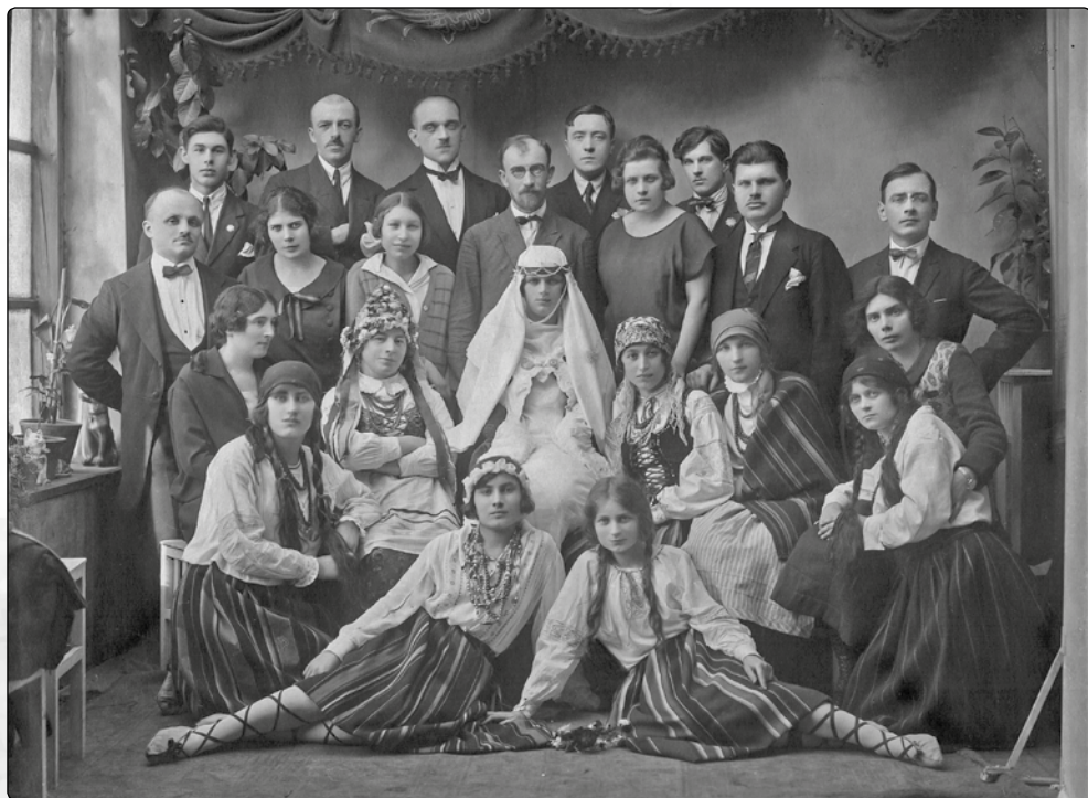
Aktorzy przedstawienia „A kćm im łzy powróci”. Lata 1918 – 1939

więzała się w tym samym czasie I Żeńska Drużyna Skautowa im. Emilii Plater. Obie drużyny podlegały Polskiej Organizacji Skautowej. Już w 1915 roku powstała redakcja pisemka „Harcerz”. W 1916 roku działał już chór skautowy pod dyrekcją Wiesława Majewskiego. 18 Rok później, w 1917 roku powstała orkiestra skautowa złożona z uczniów gimnazjum męskiego. Wtedy też Patronat Skautowy wydał cykl sześciu pocztówek zatytułowanych „Z życia skautów” przedstawiających olkuskie drużyny skautowe podczas wycieczek, podchodów i zbiórek, które odbywały się na Pomorzańskich Skałkach nieopodal Olkusza. 19 W kolejnych latach działalności