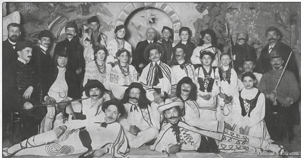
Przedstawienie „Kraowiacy i Górale” w Resursie Obywatelskiej w Olkuszu, lata 1914 – 1918

W 1913 roku dzięki pomocy Stanisława Thugutta bibliotekarza Centrali Polskiego Towarzystwa Krajoznawczego, w olkuskim oddziale PTK powstała biblioteka krajo-