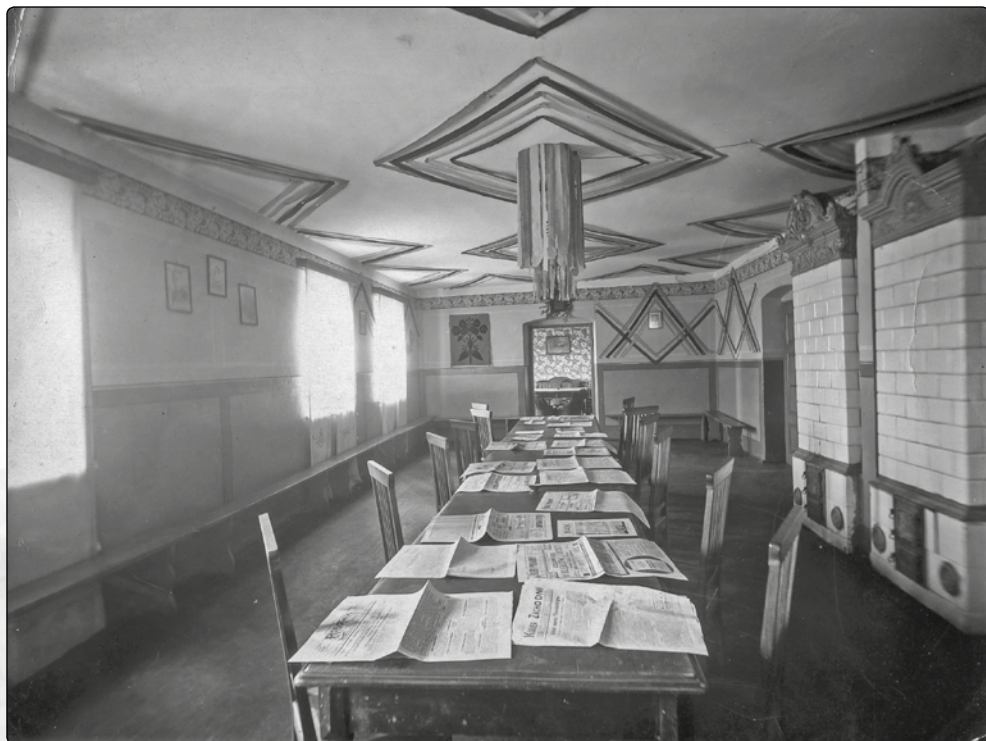
Sala olkuskiej Resursy Obywatelskiej.

Resursa mieściła się w budynku na rogu ulicy Górniczej i Plant. Pierwsza Resursa Obywatelska w Królestwie Polskim powstała w 1820 roku w Warszawie. Wkrótce zaczęły powstawać kolejne, z czego większość w miastach gubernialnych. W 1839 roku powstała resursa w Radomiu, a w 1843 w Kielcach. Jeszcze przed powstaniem styczniowym władze rosyjskie zdelegalizowały większość tych organizacji. Zaczęły się odradzać pod koniec XIX wieku. W 1895 roku powstała resursa w Dąbrowie Górniczej. Resursy były rodzajem klubów towarzyskich. Członkowie resursy płacili składki przeznaczone na jej utrzymanie, a w zamian mogli brać udział w organizowanych tu wydarzeniach artystycznych. W olkuskiej resursie organizowano kon-